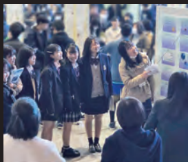
■東京都立大学と高大連携協定を締結! 都立大学での体験授業(1年生) ■学習棟 自習室として平日は午前7時30分から午後8時まで、土日休日は午前9時から午後4時30分まで開放! ■調査探究活動 一人一台のiPadも活用! 協働的な学習を通して、思考力、判断力、表現力等の育成! (調査探究活動発表会)