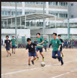
■生徒が運営、二日連続、球技大会! ■本校独自の海外語学研修制度(希望者)