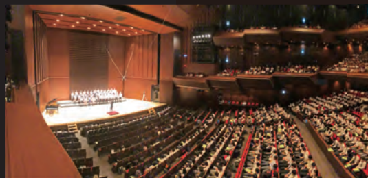
■大ホールに響き渡るアカペラのハーモニー! 全クラスが一丸となって臨む合唱祭!

一人一台のタブレット (iPad)・ペンシル! Classiを用いた教育クラウド の導入で、先進的なICT教育を推進! 本校独自の海外語学研修(希望者!) 全教室冷暖房完備、この夏、 体育館にも空調導入!